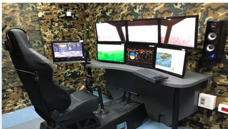
Puesto de Piloto