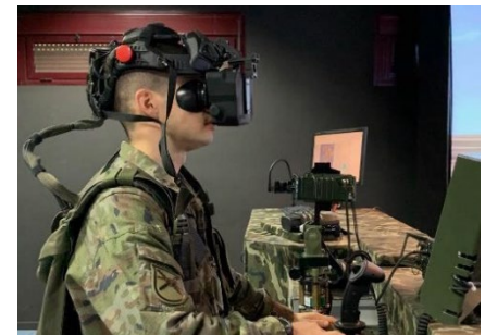
Gafas de Realidad Virtual