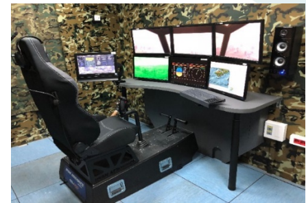
Puesto de Piloto